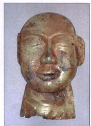
333 - Masque funéraire en bronze doré - H : 29