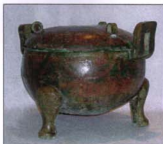
180 - Din en bronze - H : 30 - D. : 41,5