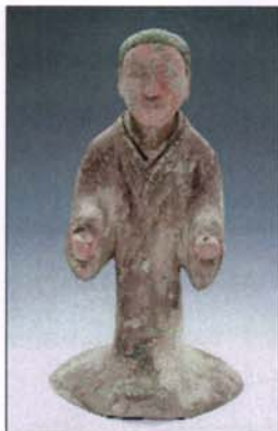
221 - Servante agenouillée, en terre cuite. - H : 38,5 cm

S.A.S. - Agrément 2001-014 8, rue Saint-Marc - 75002 Paris. - Tél. : 01 40 13 07 79 - Fax : 01 42 33 61 94 R.C.S. 440 305 183 00012 E-mail : neret@auction.fr - Internet : www.neret.auction.fr