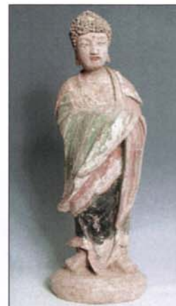
353 - Bouddha, en terre cuite H. : 65,5 cm.

3, rue de Montholon - 75009 PARIS Tél. 01 48 79 57 58