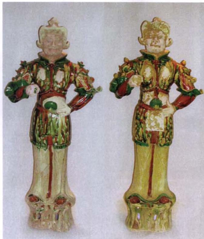
317 - Lokapala, en terre cuite vernissée - H : 107 cm