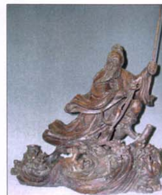
397 - Vieillard céleste en bois H : 66 - L : 47