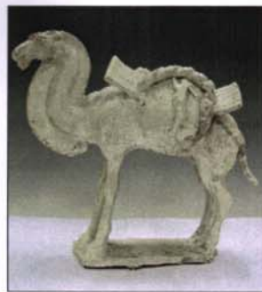
260 - Chameau en terre cuite vernissée. - H : 29 - L. : 33