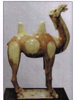
321 - Grand chameau en terre cuite vernissée - H : 85 - L. : 62