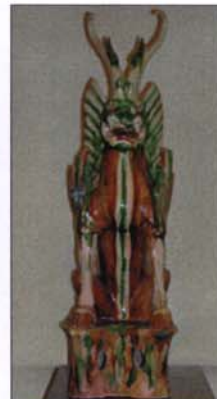
319 - Esprit en terre cuite vernissée - H : 86,5