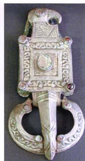
60 - Plaque boucle de ceinture. L : 12 cm.