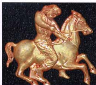
20 - Cavalier Scythe, en or IV e -III e siècle av. JC