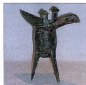
181 - Yue en bronze - H : 21