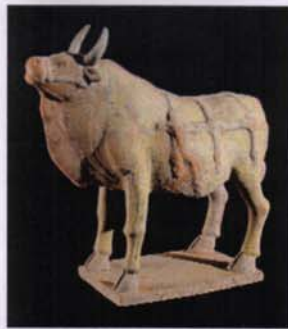
253 - Buffle harnache en terre . H : 26 - L. : 27