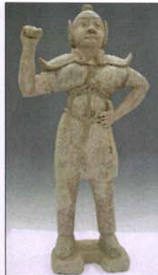
293 - Guerrier debout en terre cuite - H : 75