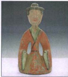
188 - Dame de cour agenouillée en terre cuite. - H : 29