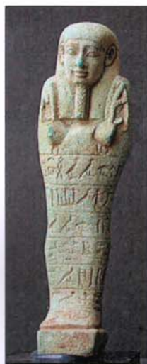
37 - Oushebti, Basse Époque de GEM HAPY