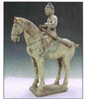
274 - Cavalier en terre cuite H : 43,5 - L. : 37