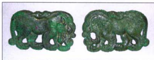
162 - Deux plaques de ceinture en bronze - L : 7 - H. : 4