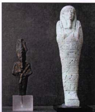
23 - Oushebti. H : 10 cm. 26 - Buste d'Osiris. H : 8,5 cm. Basse Epoque.