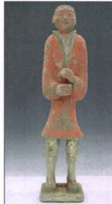
198 - Porte étendard en terre cuite - H : 59