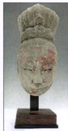
347 - Tête de matriarche en pierre - H : 32